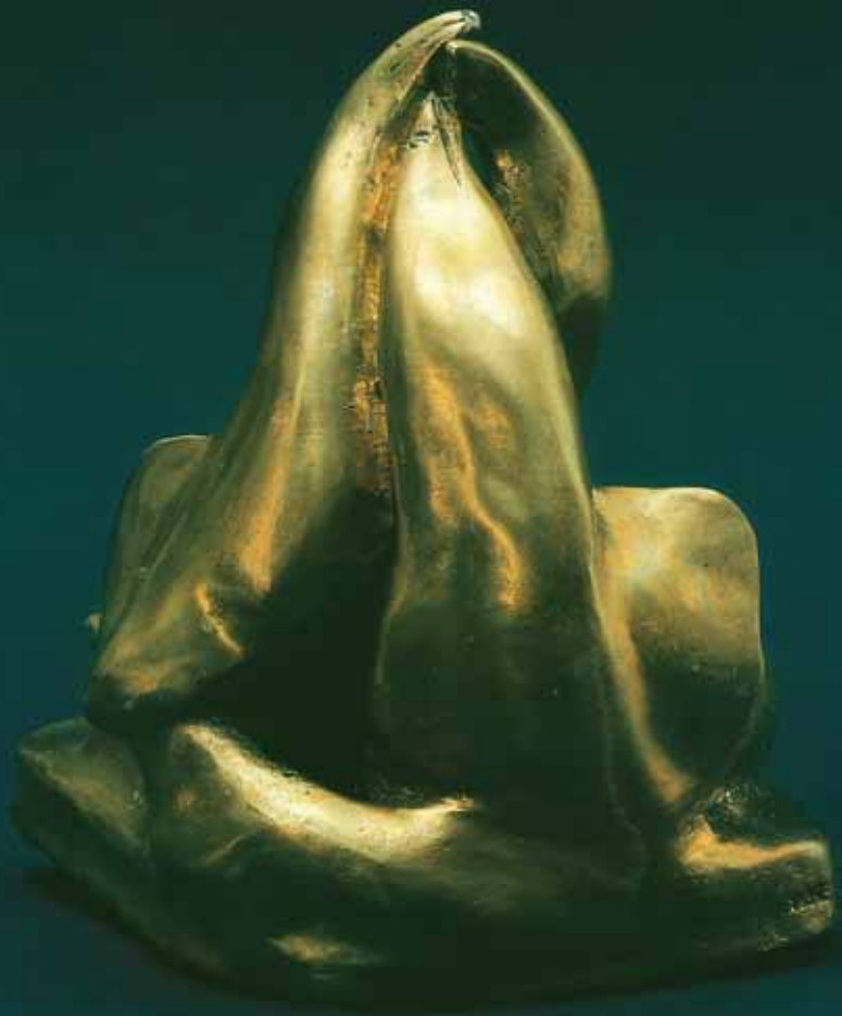
Rencontre des dauphins bronze de Slavik

photo de Lamberto Scipioni issue de "Sculptures évolutives" par Slavik ed. Mazzotta